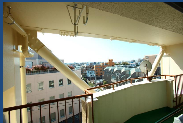
南棟 室内から 観たブレース