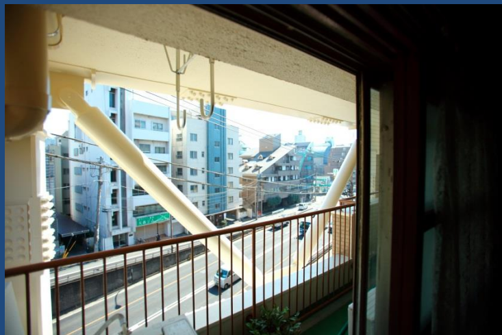
北棟 室内から 観たブレース